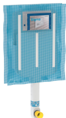
Figura di esempio